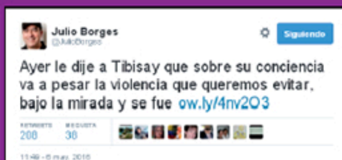
Threats by political leaders