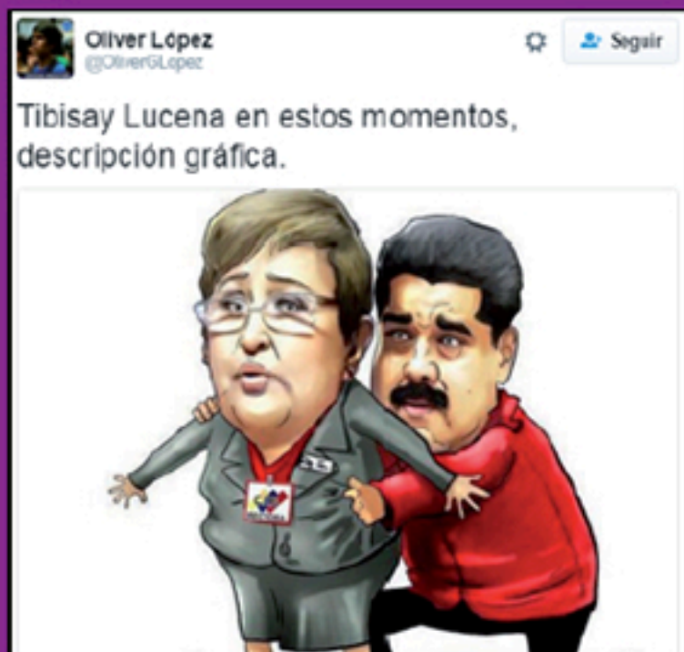
April 2016 HATRED CAMPAIGN