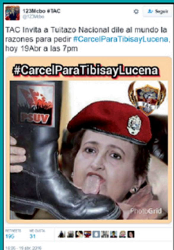
April 2016 HATRED CAMPAIGN