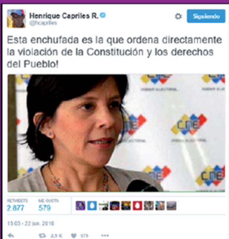
HATRED CAMPAIGN WITH THE PARTICIPATION OF RELEVANT POLITICAL LEADERS